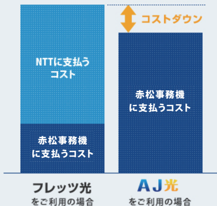
トータルコストイメージ

AJアクセス回線、AJ光TEL、ISPサービスを組み合わせることにより、充実したサービスを低コストでご提供いたします。